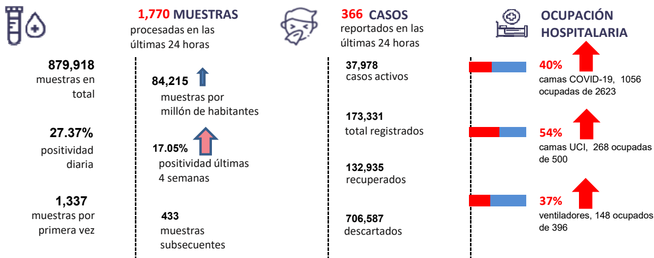
Figura 1. Tendencia de los casos y positividad de COVID-19 en República Dominicana